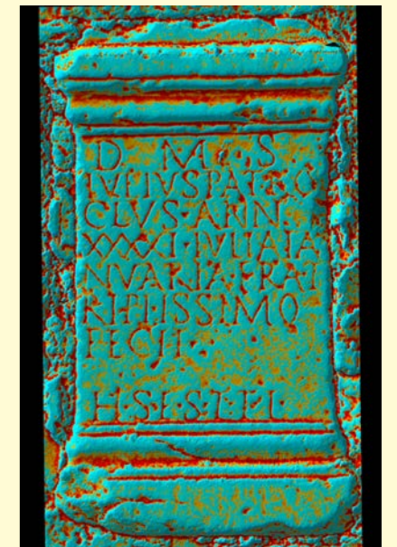
Inscripción funeraria de Augusta Emerita, Mérida, Badajoz, con técnica M.R.M. CIL II 565.