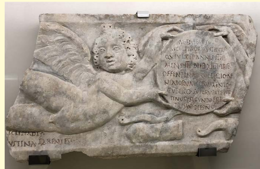
Fragmento de sarcófago, Terme di Diocleziano, Museo Nazionale Romano, Roma, Italia. CIL VI 10221.

La exposición “ Siste, viator : la epigrafía en la antigua Roma” pretende mostrar qué es la epigrafía, sus usos e importancia en el mundo romano, su utilidad para la investigación histórica y cómo esta se ha desarrollado en el pasado y en el siglo XXI. Se enfoca de manera divulgativa y para todos los públicos con el fin de acercar al visitante a la sociedad y vida cotidiana romanas a través de las inscripciones. Para ello, el usuario podrá contemplar fotografías de muy diversos epígrafes, piezas auténticas procedentes de distintos Museos y yacimientos de la península Ibérica, así como otros recursos y material de trabajo de los que se servía el epigrafista en el pasado y se sirve actualmente (calcos, reproducciones, monografías antiguas, corpus...). También, por medio de paneles explicativos, material audiovisual y recreaciones, el visitante recibirá, de manera clara y sencilla, información básica y útil para entender el mundo romano. Además de acercar al interesado a esta civilización, se busca concienciar al mismo de la importancia de estudiar y preservar el pasado material y, al mismo tiempo, insuflarle interés sobre la Antigüedad y, más particularmente, sobre los testimonios escritos.