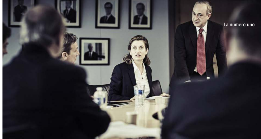
La número uno

Charlie Thompson, un chico de quince años que queda solo al morir su padre, emprende junto a un caballo de carreras robado un peligroso viaje en busca de su tía, de la cual no tiene noticias desde hace tiempo, y un nuevo hogar.