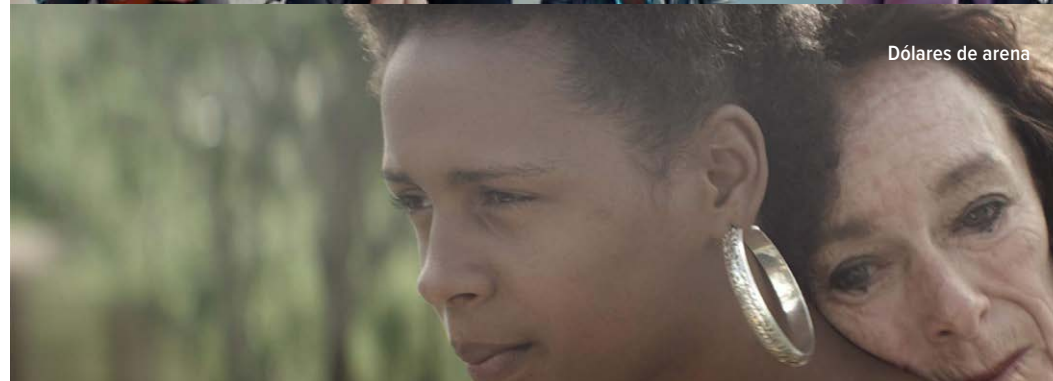
Dólares de arena